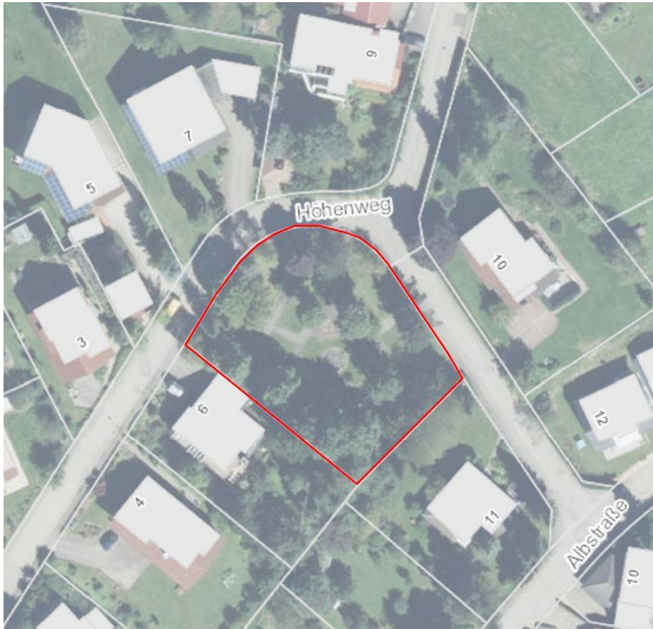
Abbildung 2: Plangebiet mit hinterlegtem Luftbild (1:500)

etwa 1 – 1,20 hohe Holzzäune. Das südwestlich gelegene Grundstück ist, aufgrund des hohen Gehölzbestandes schwer einsehbar.