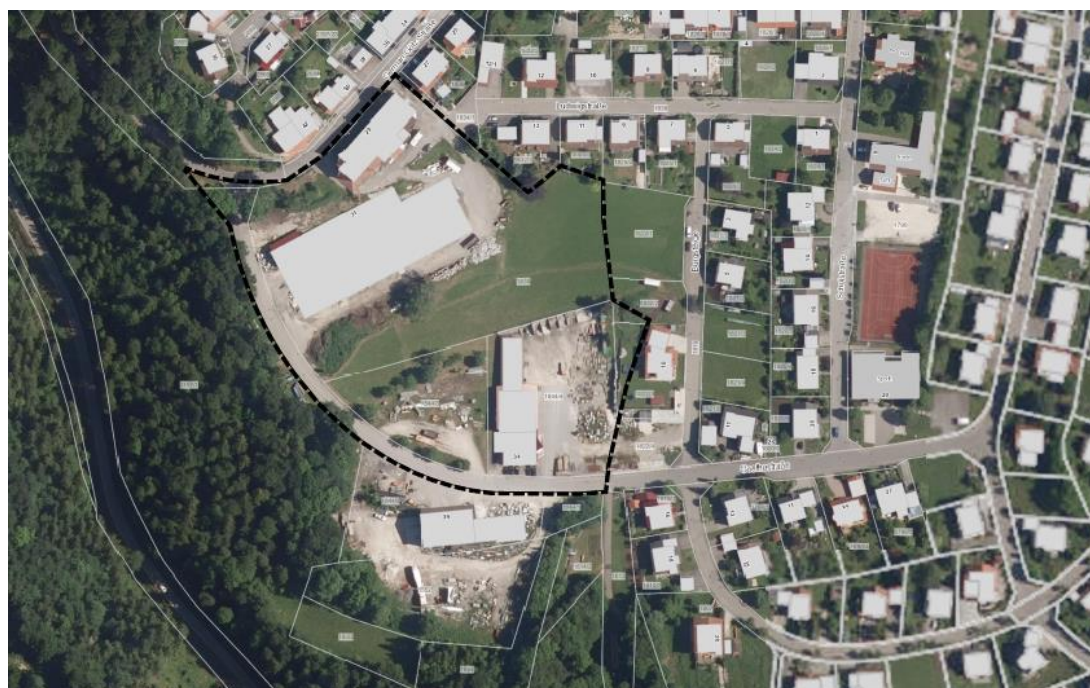
Abbildung 2: Abgrenzung des räumlichen Geltungsbereichs des B-Plans „Kapf II, 4. Änderung“

Die Abgrenzung des räumlichen Geltungsbereichs der 4. Änderung des Bebauungsplanes „Kapf II“ kann der nachfolgenden Abbildung entnommen werden.