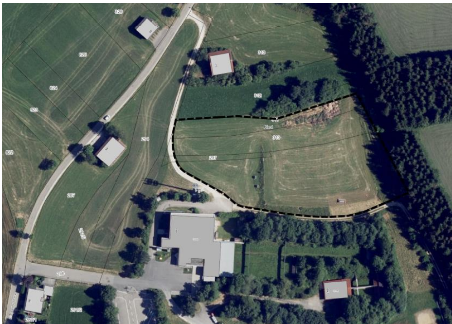
Abbildung 3: Räumlicher Geltungsbereich des Bebauungsplans

Die Abgrenzung des räumlichen Geltungsbereiches kann dem Lageplan der nachfolgenden Abbildung entnommen werden.