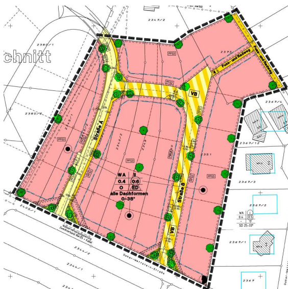
Bebauungsplan „Loh“ (rechtskräftig seit 15.02.2019)

Im Sinne der Vereinheitlichung und um Missverständnissen vorzubeugen, wird der Bebauungsplan im Ganzen neu gezeichnet und die Festsetzungen des ursprünglichen Bebauungsplans sowie der ersten Änderung in einem Planwerk klarstellend zusammengefasst. Die Grundzüge der städtebaulichen Planung werden durch die geänderte Straßenführung und Neufassung des Bebauungsplans nicht berührt. Am ursprünglichen städtebaulichen Konzept wird festgehalten.