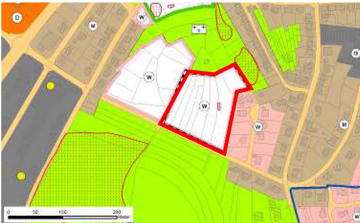
Auszug Flächennutzungsplan Verwaltungsgemeinschaft Meßstetten-Nusplingen-Obernheim, 1. Änderung

Im Flächennutzungsplan der Verwaltungsgemeinschaft Meßstetten-Nusplingen-Obernheim (1. Änderung, rechtswirksam seit 16.11.2018) sind die Flächen innerhalb des Plangebiets als Wohnbauflächen ausgewiesen. Demnach ist der Bebauungsplan gemäß § 8 (2) BauGB aus dem Flächennutzungsplan entwickelt.