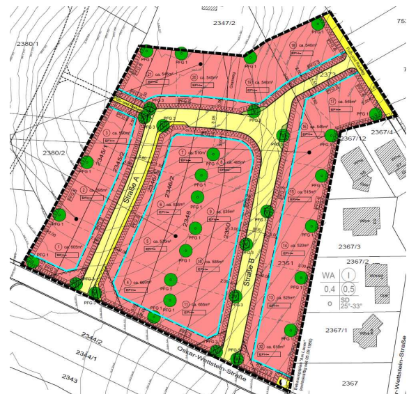
Bebauungsplan „Loh, 1. Änderung“ ohne Maßstab

Mit Ausnahme weniger Baulücken im Innenbereich sind vorhandene Baugrundstücke, die direkt einer Bebauung zugeführt werden können, im Ort nahezu ausgeschöpft. Verfügbare Flächenpotenziale befinden sich in Privateigentum und sind dem freien Markt nicht zugänglich. In der Stadt besteht dennoch weiterhin eine anhaltend hohe Nachfrage nach Baugrundstücken. Die langfristige Wohnbauentwicklung in Ergänzung zum innerörtlichen Potential sieht die Stadt entlang der Oskar-Wettstein-Straße. Das geplante Neubaugebiet stellt einen städtebaulichen Gesamtzusammenhang zwischen den Siedlungskörpern entlang der Blumersbergstraße im Westen und der Zeurengasse im Osten her.