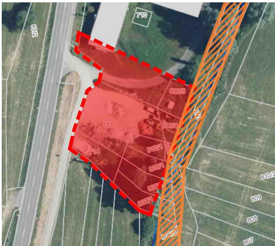
Planungsgebiet (rot-transparente Fläche), FFH-Gebiet „Östlicher Großer Heuberg“ (orangefarbene Schraffur) Abbildung 2: Lageplan mit hinterlegtem Luftbild, unmaßstäblich