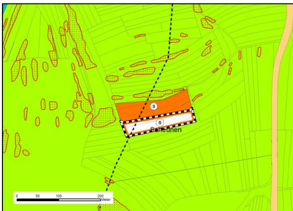
Abbildung 8: Ausschnitt des FNP, unmaßstäblich

Der Bebauungsplan ist somit aus dem rechtskräftigen Flächennutzungsplan entwickelt.