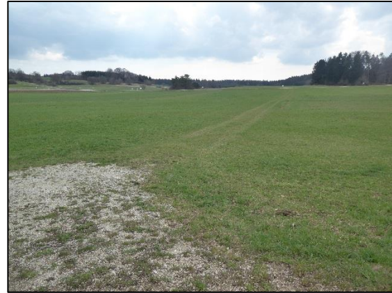
Abb. 4: Blick nach Süden im östlichen Teil des Plangebiets