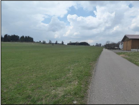
Abb. 3: Blick nach Westen entlang der bestehenden Erschließungsstraße (Plangebiet links)