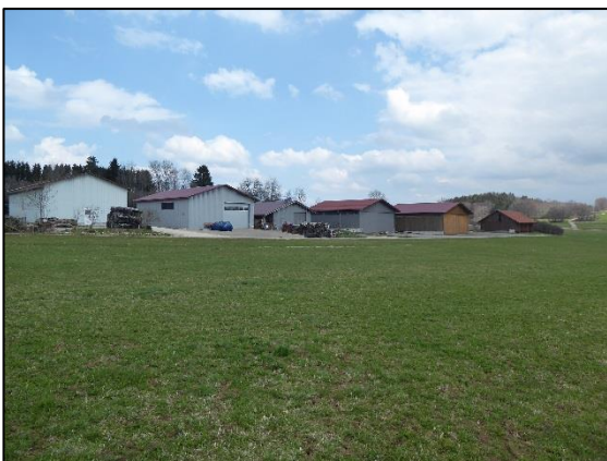
Abb. 1: Blick nach Norden über das Plangebiet in das bestehende Schuppengebiet

Nachfolgende Fotos geben einen Eindruck der Gebietserweiterung wieder.