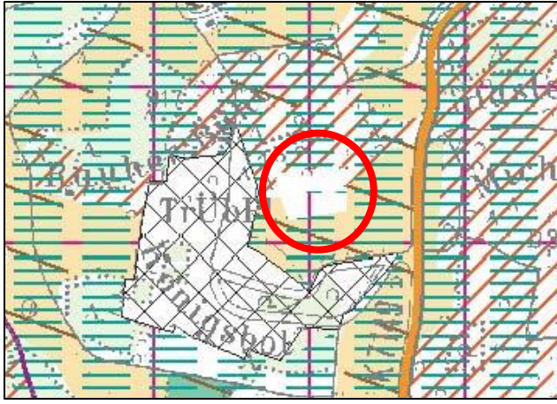
Abbildung 7: Ausschnitt aus dem Regionalplan Neckar-Alb 2013 (ungefähre Lage = rot)