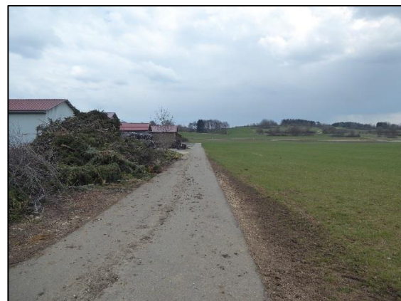
Abb. 2: Blick nach Osten entlang der bestehenden Erschließungsstraße (Plangebiet rechts)