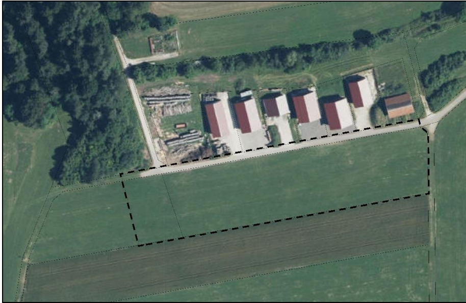
Abbildung 6: Räumlicher Geltungsbereich des Bebauungsplans (schwarze Balkenlinie)