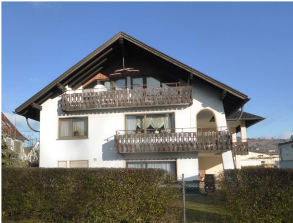
Frontansicht des Wohnhauses

Das Flurstück 706/1 wird derzeit für wohnliche Zwecke genutzt. Auf dem Grundstück befindet sich ein Wohnhaus, welches in der folgenden Abbildung darstellt ist.