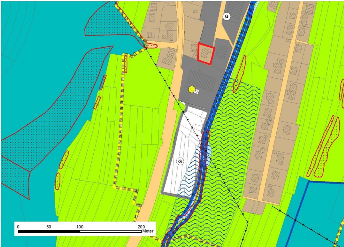
Abbildung 5: Ausschnitte aus dem FNP (Plangebiet = rote Umrandung)

Der seit dem Jahr 2010 wirksame Flächennutzungsplan des GVV Meßstetten weist den Bereich des Plangebietes als Fläche für eine gemischte Nutzung aus Gewerbe und Wohnen aus.