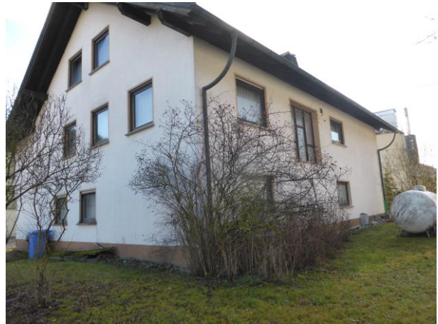
Rückansicht des Wohnhauses