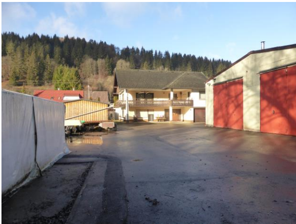
Mischung gewerbliche und wohnliche Nutzung