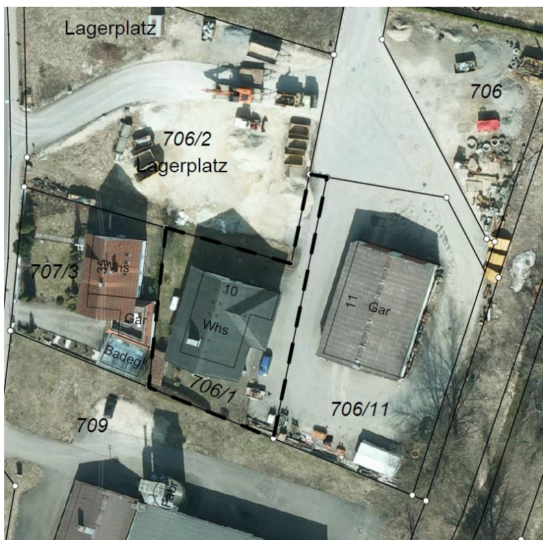
Abbildung 3: Räumlicher Geltungsbereich des Bebauungsplans, unmaßstäblich

Die Abgrenzung des räumlichen Geltungsbereiches kann dem Lageplan in der nachfolgenden Abbildung entnommen werden.