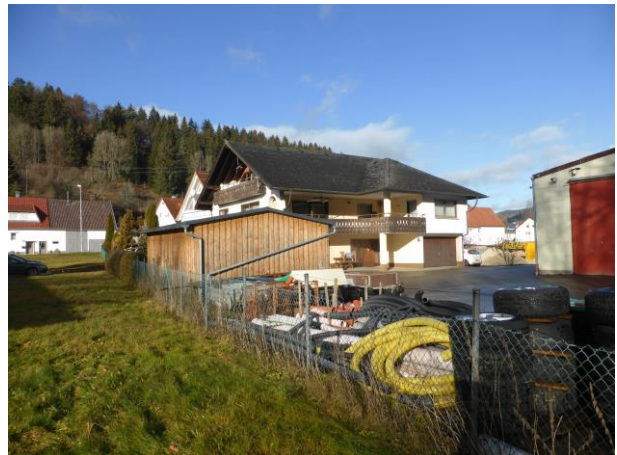
Mischung gewerbliche und wohnliche Nutzung